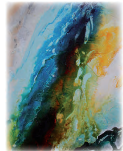
Elvira Gerhäuser Saugendorf