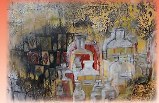
Sabine Lodes Hetzles