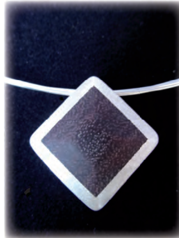
Michaela Ulrich Puschendorf