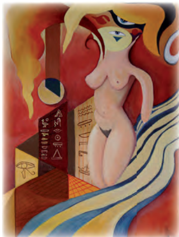
Erwin Schraudner Hollfeld